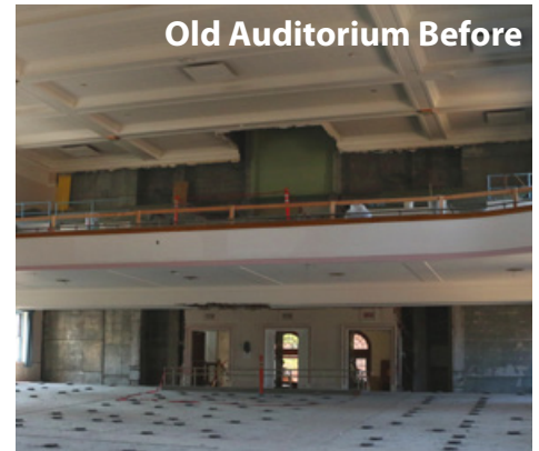
Old Auditorium Before

www.pps.k12.or.us/files/bond/RHS_Fall_Access_Plan-Web_15-08.pdf