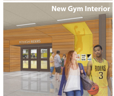
New Gym Interior

Las Escuelas Públicas de Portland son un empleador de acción afirmativa que ofrece igualdad de oportunidades.