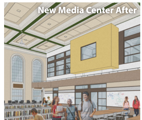
New Media Center After