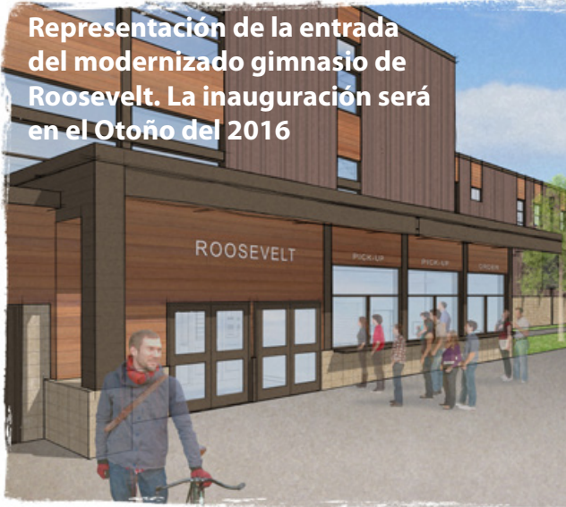
Representación de la entrada del modernizado gimnasio de Roosevelt. La inauguración será en el Otoño del 2016